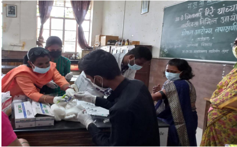
Society participants in Health Check up Camp.